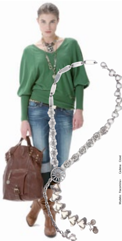
Modelo: Encamina • Cadena: Craxé

Las tendencias de esta temporada otoño-invierno 2010/11 presentan una bisutería vintage y barroca de estilo romántico. En los complementos, los collares se convierten en protagonistas indiscutibles de las pasarelas P. 10 y 11