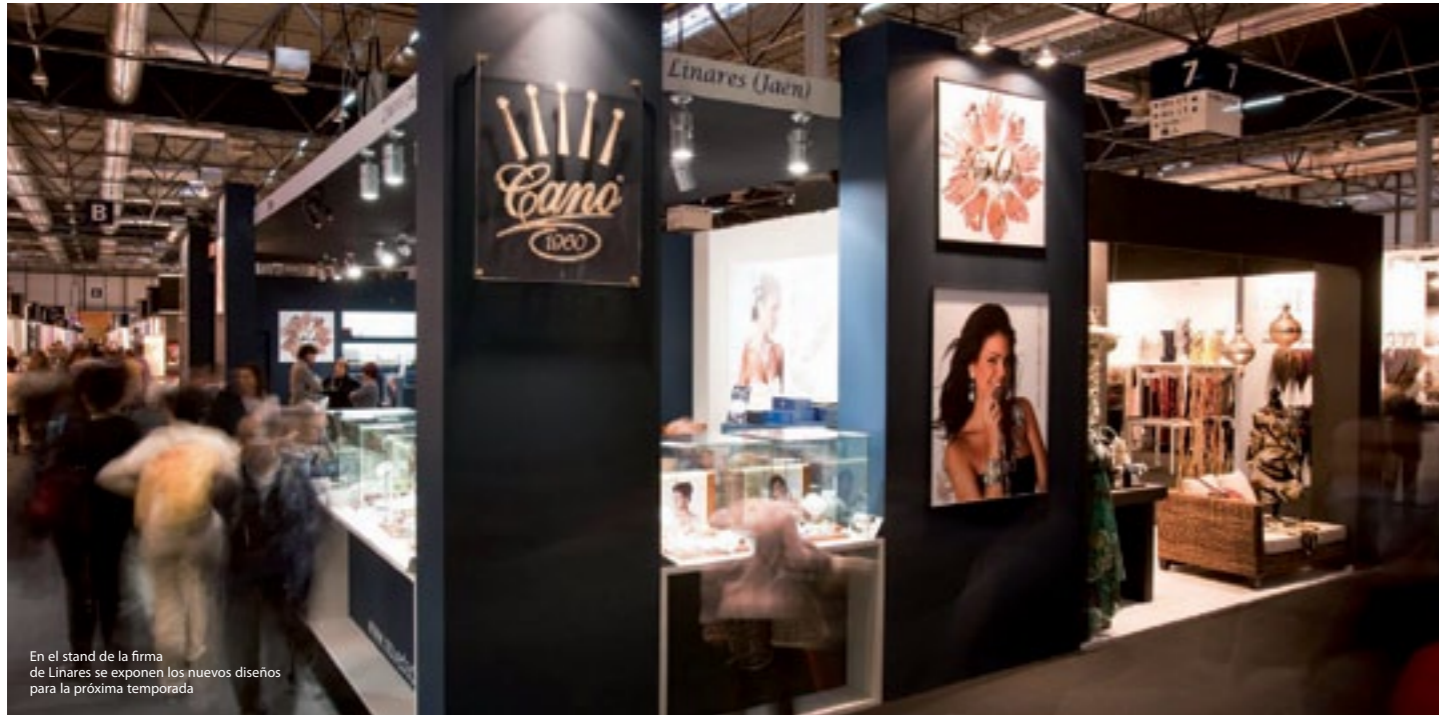
En el stand de la firma de Linares se exponen los nuevos diseños para la próxima temporada

La firma de alta bisutería celebra en el Hotel Palace de Madrid la II edición de la Pasarela Cano