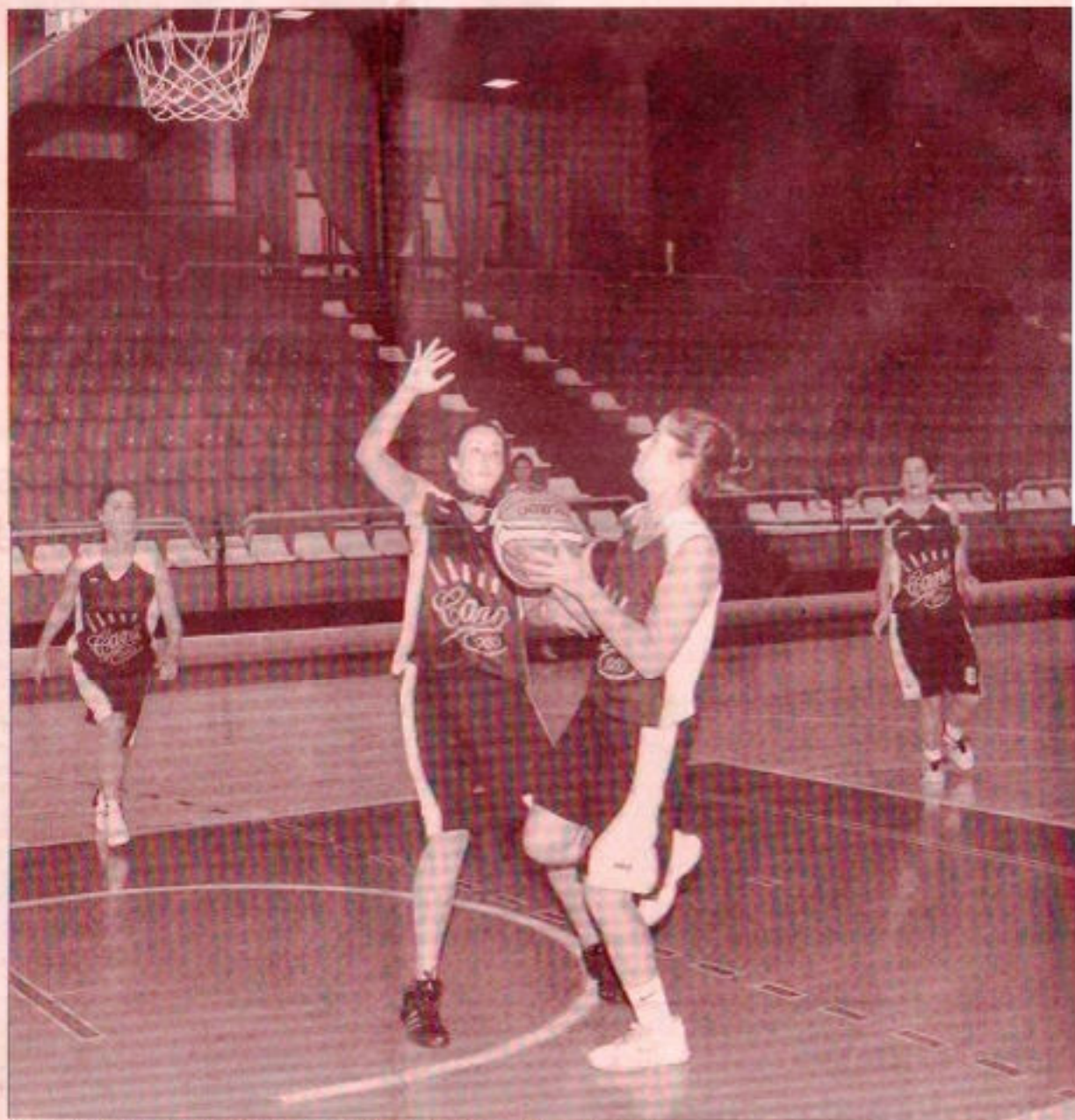
El equipo sénior cuenta con jugadoras que debutan en Primera División Femenina.