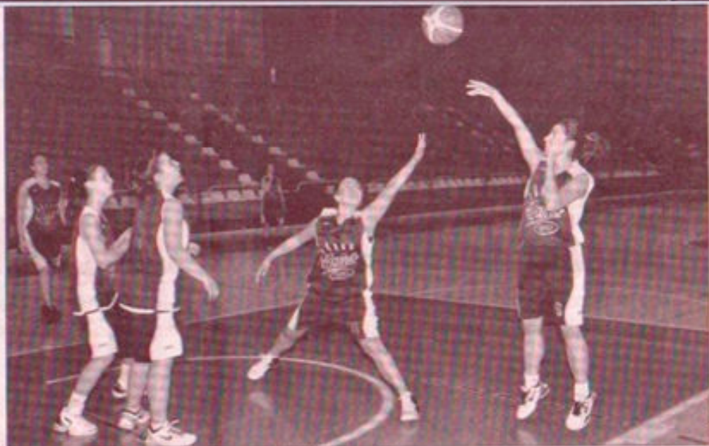
Entrenamiento del conjunto linaresense en el Pabellón Julián Jiménez.

El equipo linaresense empieza la Liga en casa ante el CB Roquetas, a partir de las 12 horas