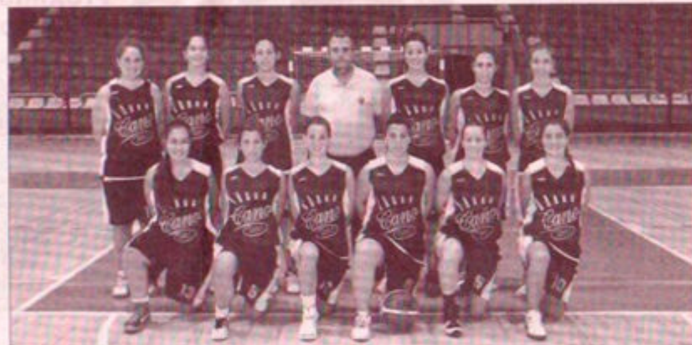
Plantilla del CAB Linares, que mañana debutará en la Liga con un partido en casa ante el Roquetas.