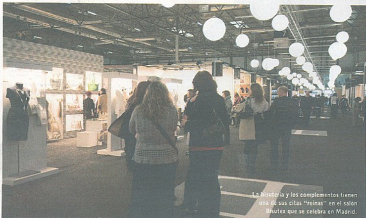
La bisutería y los complementos tienen una de sus citas "reinas" en el salón Bisutex que se celebra en Madrid.

En su 43 edición Bisutex se presenta más chic que nunca en sus propuestas, reunidas en el pabellón 7 de la Feria de Madrid del 10 al 14 de septiembre. Las nuevas tendencias para otoño-invierno 08/09 en bisutería y complementos tienen uno de sus